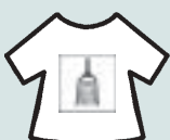
Frente Independiente Moralizador