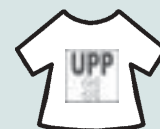
Unión por el Perú