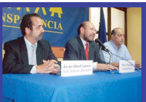
La firma del convenio tuvo lugar el 26 de febrero en la sede de Transparencia.

TRANSPARENCIA ha firmado acuerdos similares con el Partido Popular Cristiano, el Partido Aprista Peruano, Acción Popular, la Coordinadora Nacional de Independientes y el Partido Perú Ahora.