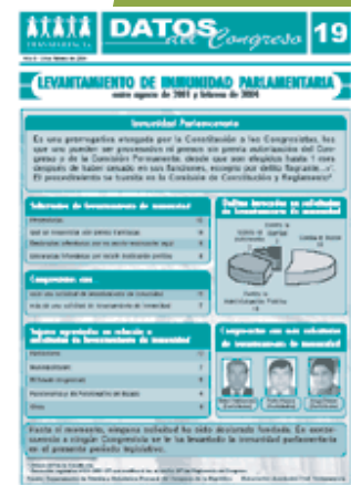
El documento detalla los casos de levantamiento de inmunidad parlamentaria y las acusaciones constitucionales.

Las personas con más acusaciones constitucionales durante el presente período legislativo han sido: Alberto Fujimori (57); Teófilo Idrogo (25) y Jorge Angulo (24), ambos miembros del Consejo Nacional de la Magistratura (CNM); Carlos Bergamino, ex Ministro de Defensa durante el gobierno de Fujimori (23); y Ricardo La Hoz, miembro del CNM, (23).