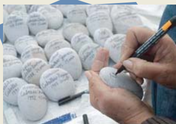
Nombres para recordar, piedras-símbolo de las miles de víctimas por la violencia política estarán en la Alameda de la Memoria.

Como parte de las actividades por el segundo aniversario de la entrega del Informe Final de la Comisión de la Verdad y Reconciliación, el 28 de agosto se inauguró la primera etapa de la Alameda de la Memoria, en el Campo de Marte en Jesús María. Dicha alameda alberga la escultura "El ojo que llora", reparación simbólica para los deudos de las víctimas de la violencia política.