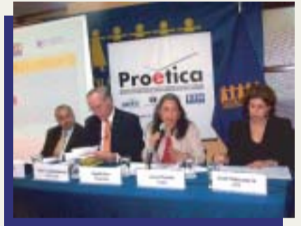
Sectores e Instituciones Nacionales * - ¿corruptos o transparentes?

Un sondeo realizado por Transparency International, en 62 países del mundo que abarca a unos 50 mil encuestados, presentado por TRANSPARENCIA y Proética, señala que en el Perú y en otros 35 países del mundo, los partidos políticos son percibidos por la ciudadanía como las instituciones más corruptas.