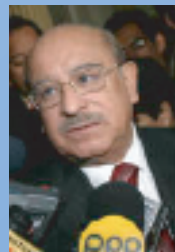
Valentín Paniagua Frente de Centro