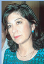
Martha Chávez Alianza por el Futuro