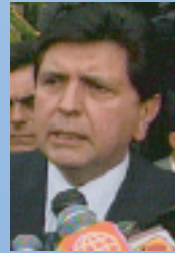
Alan García APRA