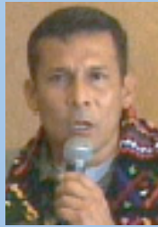
Ollanta Humala Unión por el Perú